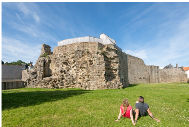
Le Grand Rempart

Les progrès réalisés dans la mise en défense des places fortes ont été considérables au Moyen Âge