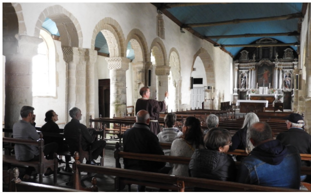
Jean-Paul ELUDUT présentant l'architecture romane de l'église Saint-Pierre (70 personnes ont assisté à cette visite)