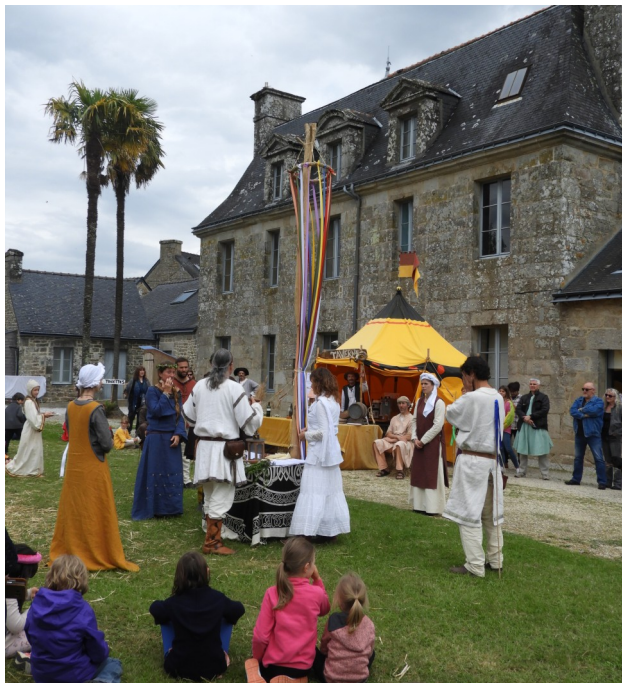
Cérémonie, l'arbre de mai